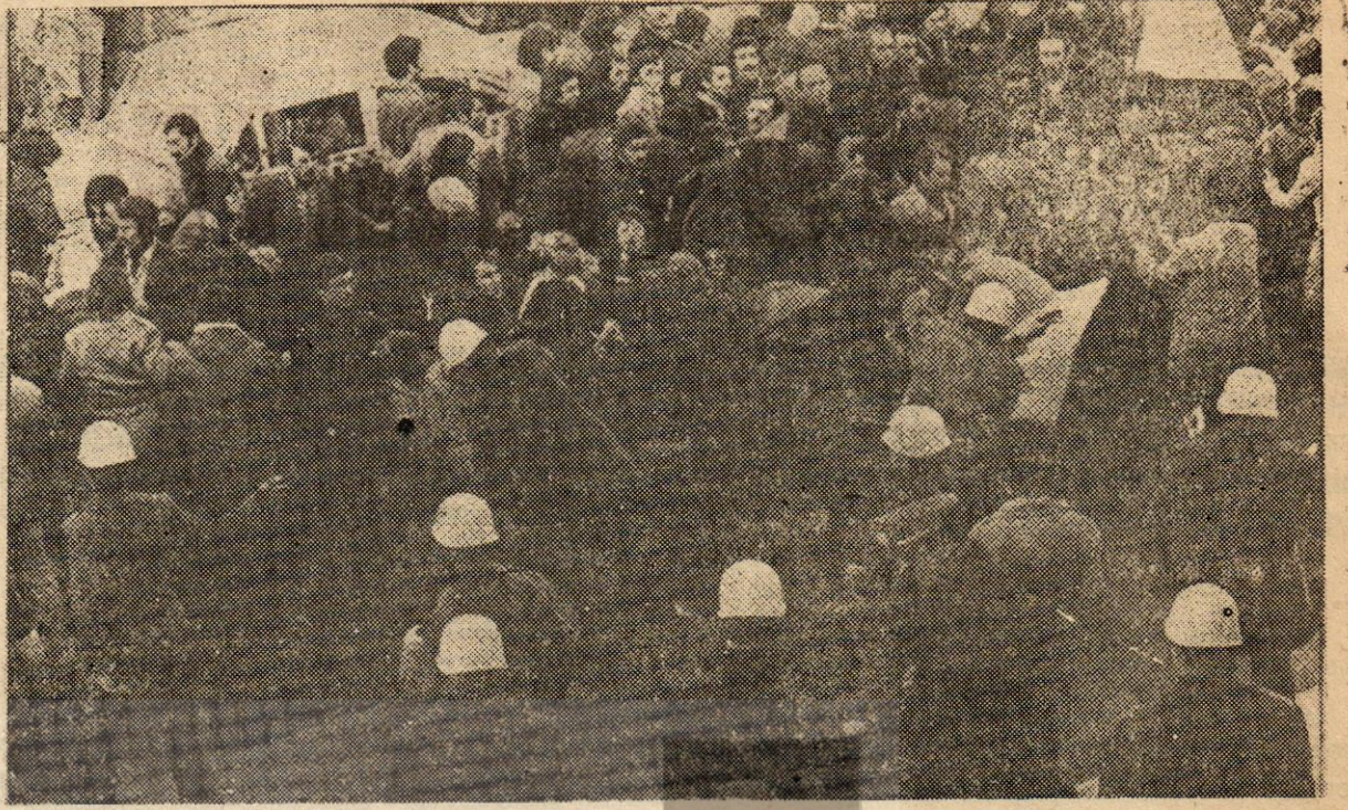
BEKO işçileri 16 Haziran Şanlı direnişinin geleneğini sürdürüyor, «HAK VERİLMEZ ALINIR»

Böylece BEKO İşçileri patronun ve sarı sendikanın gözleri önünde tam bir inanç ve beraberlikle Cevher-İş'ten istifa ederek, sarı sendika çemberini kırmışlar ve Maden-İş sendikasına katılmışlardı. Ancak, geçmiş dönem