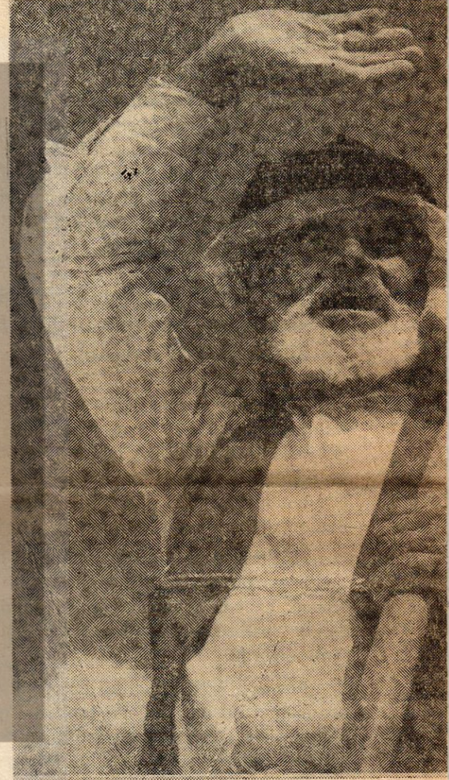
M. H. B. ... tarafından beğenilmiştir TÜSTAV

«YOKSUL KÖYLÜLÜK, ŞEHİR VE KÖY PROLETARYA BİRLİĞİ DURUMUNDADIR. ONUN BU DÜŞÜNDE DE YANSIYACAKTIR. BİLİMSEL SOSYALİ KUŞANMIŞ OLAN PROLETER DEVRİMCİ PARTİ, YASININ ÖNCÜ MÜFREZESİ OLMAKLA YETİNEM